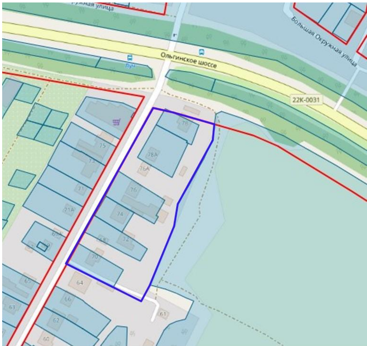
Схема границ подготовки документации по планировке территории